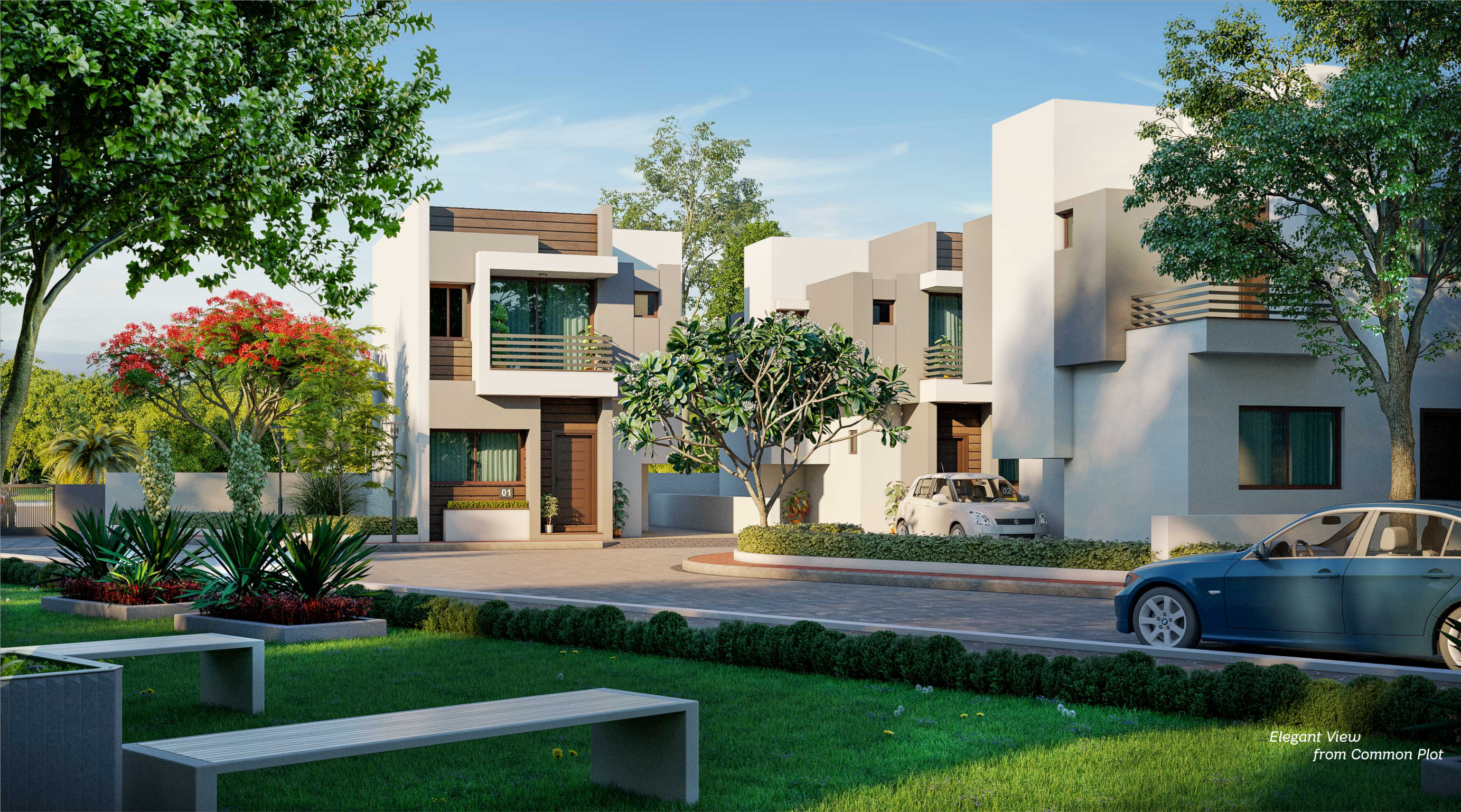
Elegant View from Common Plot