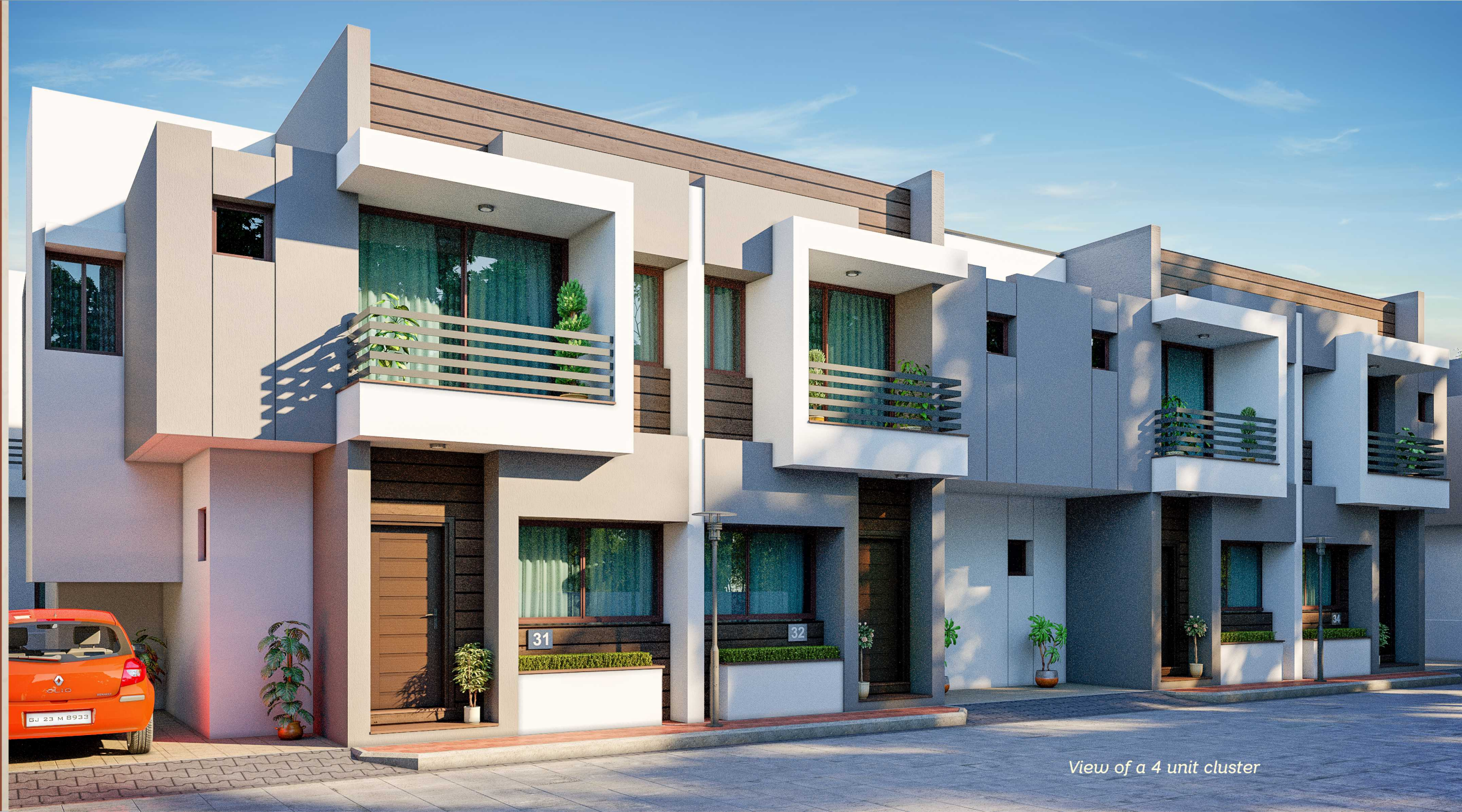
View of a 4 unit cluster