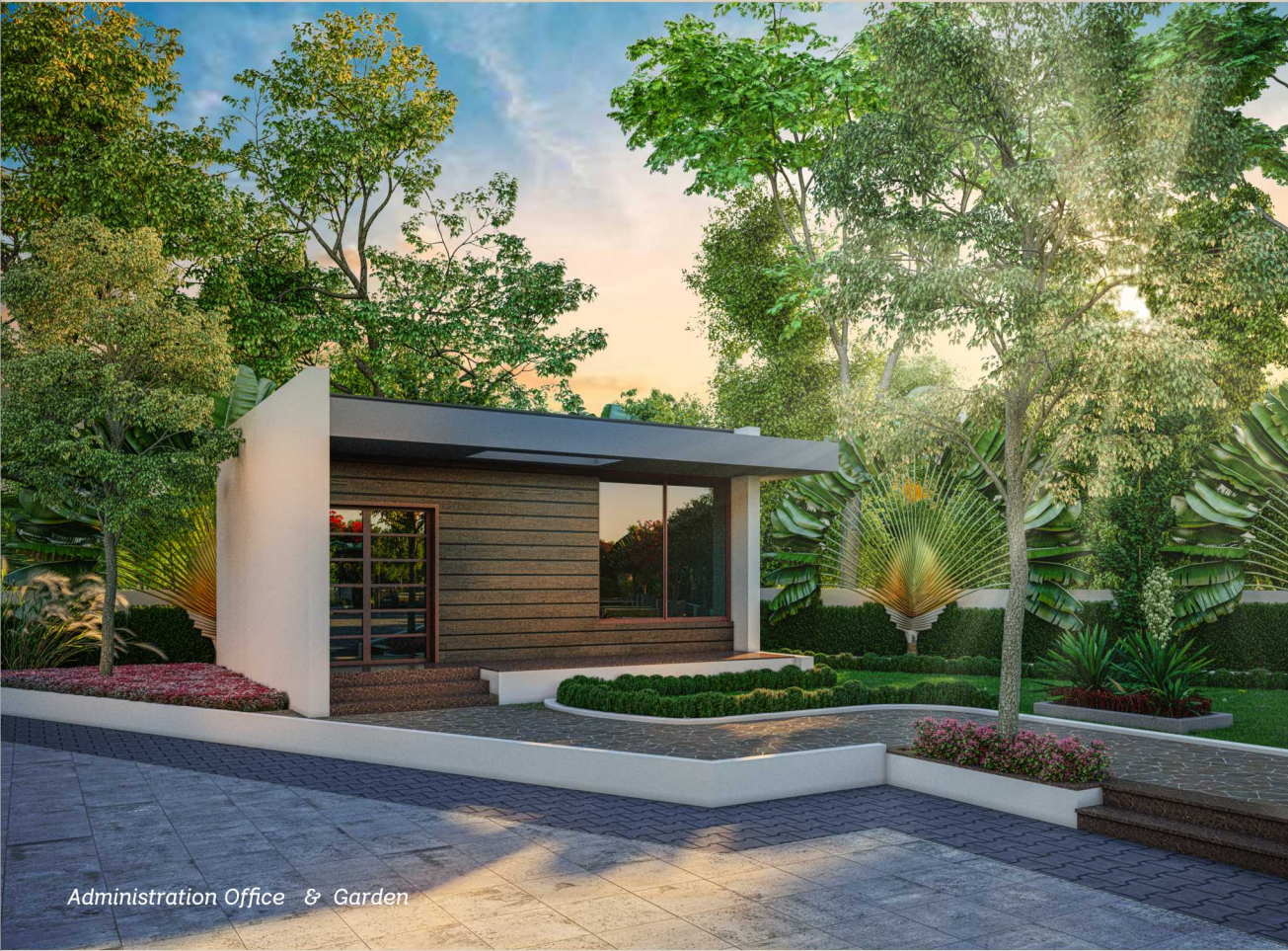
Administration Office & Garden