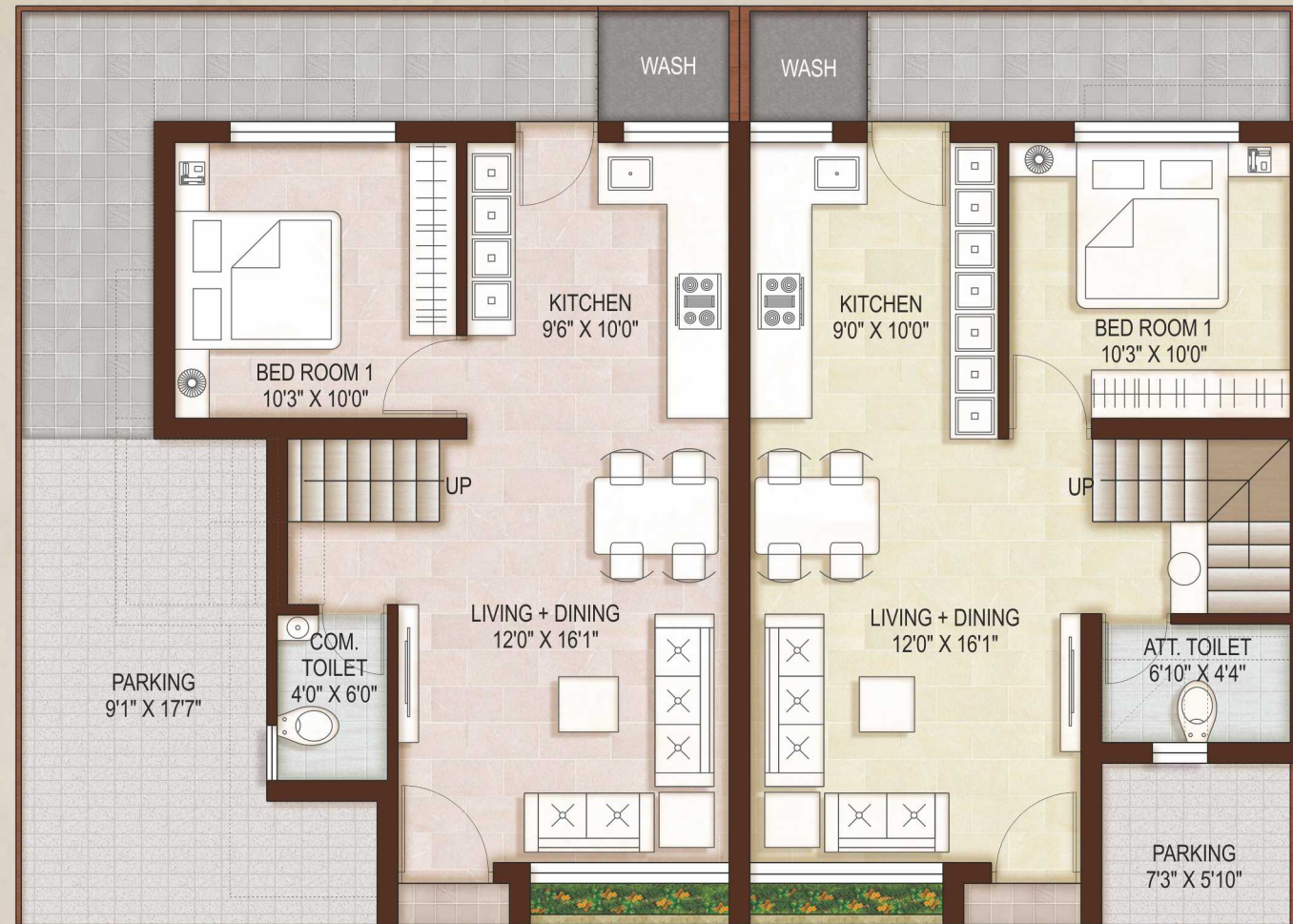
GROUND FLOOR PLAN CORNER UNITS

Plot Nos : 01, 02, 05, 06, 09, 10, 12A, 14, 17, 18, 21, 22, 25, 26, 27, 30, 31, 34, 35, 36, 37, 38, 39, 42, 43, & 46