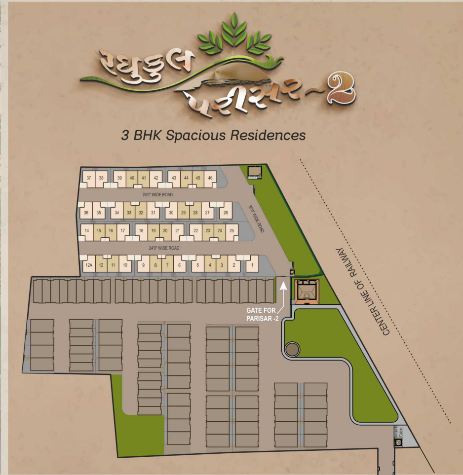
3 BHK Spacious Residences

સોસાયટીને ફરતે કમ્પાઉન્ડ વોલ | આકર્ષક મેઈન ગેટ | ૨૪ કલાક પાણીની સુવિધા અંદરના સ્ટ્રીટ લાઈટ સાથેના આર.સી.સી. / પેવર બ્લોક રોડ કોમન પ્લોટ્સમાં બાગ-બગીચા | વોક-વે તથા વડીલોના વિસામા સર્મી બેઠકો નગરપાલિકાની ગટર વ્યવસ્થા ઉપલબ્ધ | લોન પેપર ઉપલબ્ધ