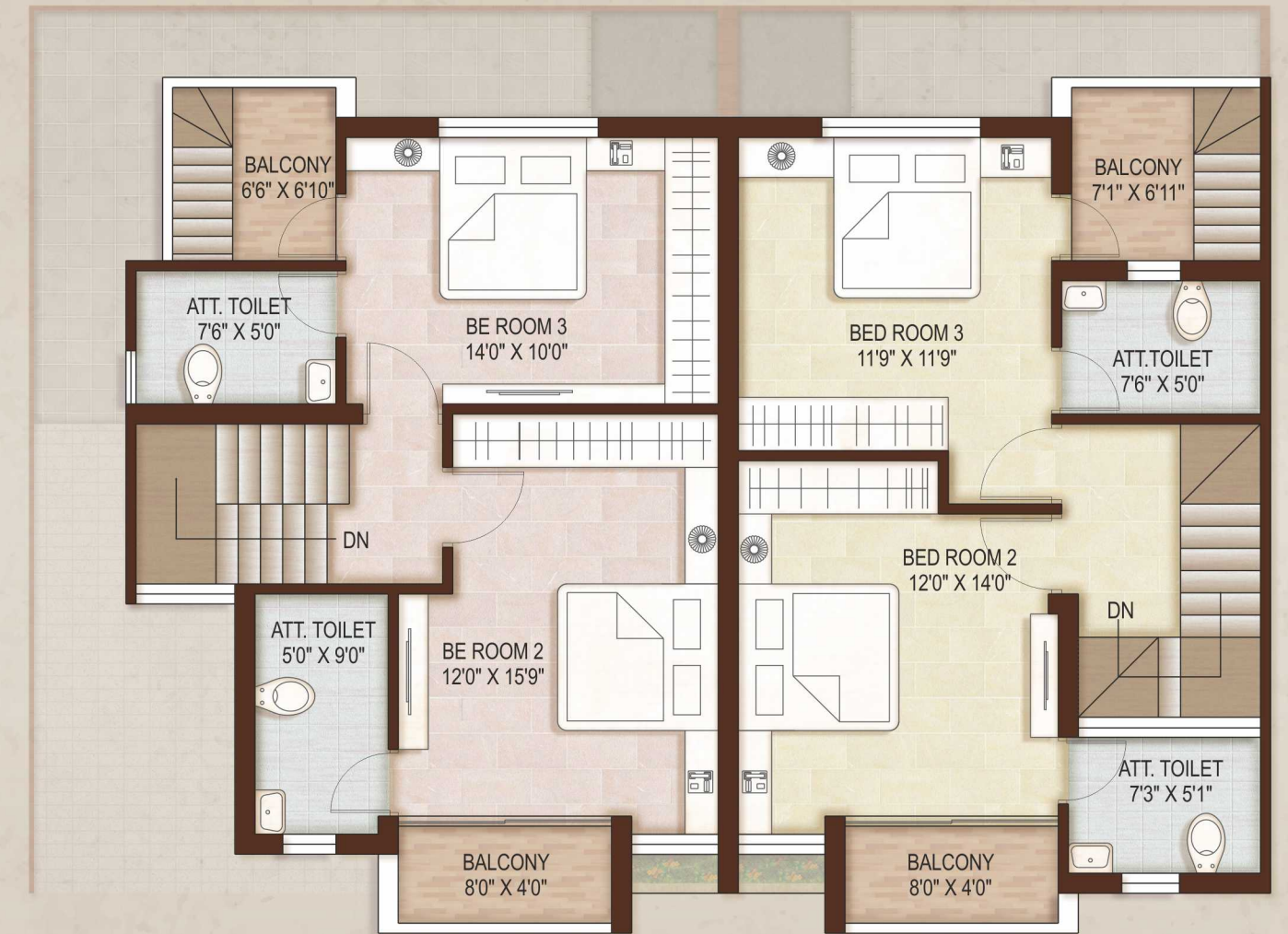
FIRST FLOOR PLAN CORNER UNITS

Plot Nos : 01, 02, 05, 06, 09, 10, 12A, 14, 17, 18, 21, 22, 25, 26, 27, 30, 31, 34, 35, 36, 37, 38, 39, 42, 43, & 46