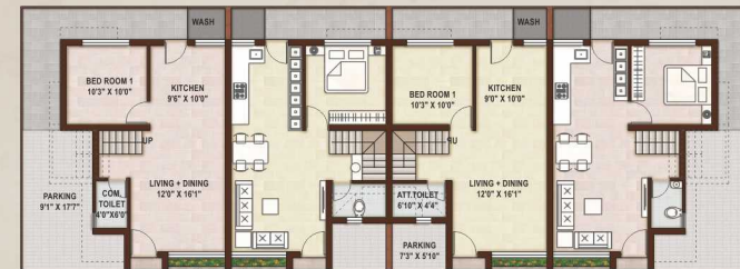
GROUND FLOOR : CLUSTER PLAN