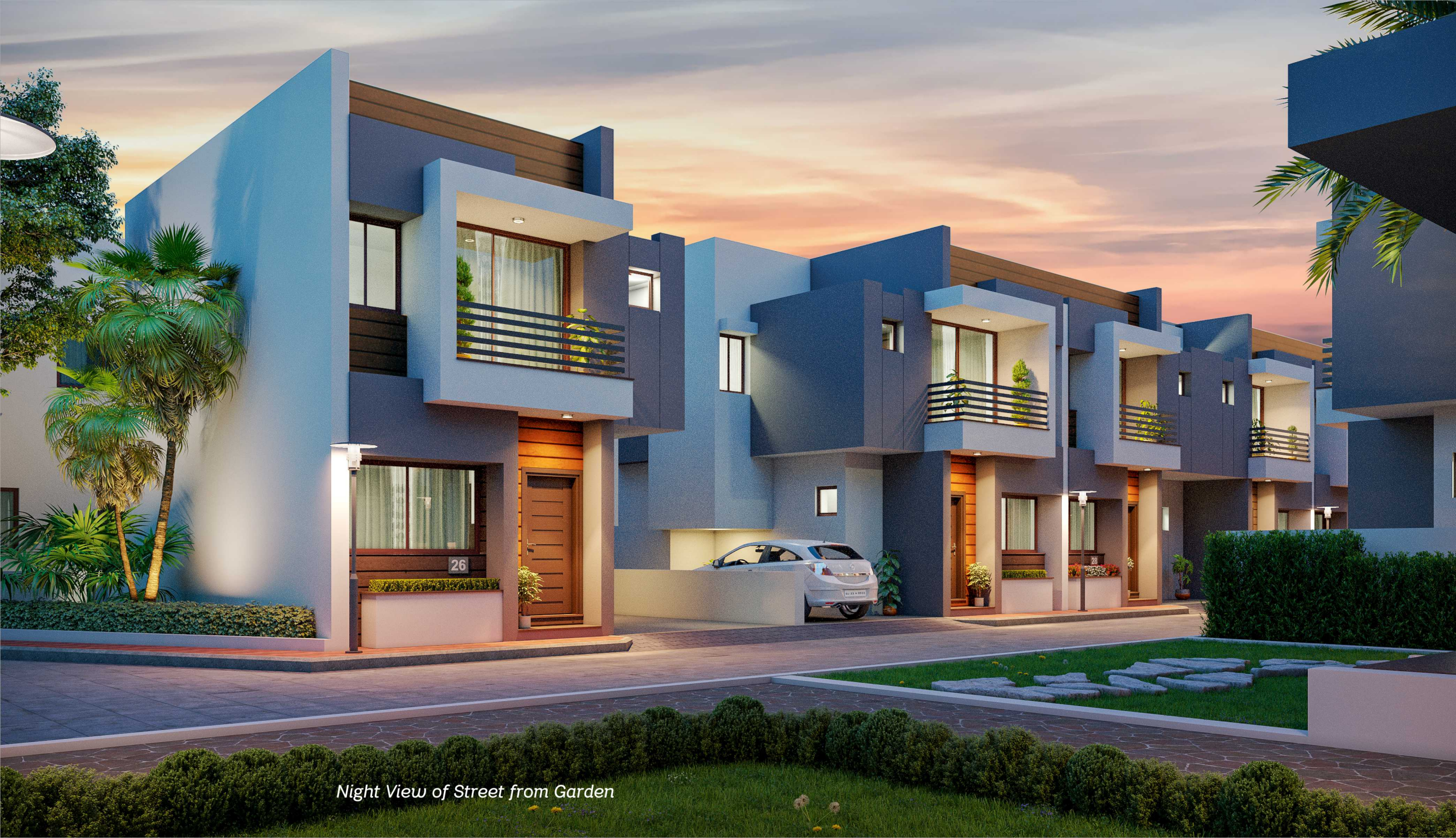
Night View of Street from Garden